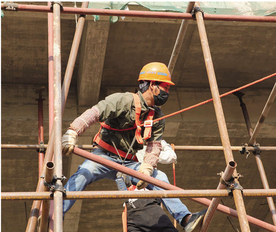
进入3月，电力公司农网改造升级在建项目陆续复工，各项工地又逐渐恢复了往日的施工景象。电力公司加大了现场督导工作力度，施工单位根据具体作业项目，有针对性地采取三班倒的方式加紧施工，尽最大努力追回疫情影响的工程进度。（李云生）